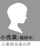
小売業（福岡市） 人事担当者の声

期間：2023年10月4日（水）～2024年2月15日（木） 全5日間 + 選択共通講座 対象：課長相当職以上もしくは昇進予定の方 定員：20名（先着順）