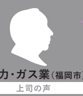
電力・ガス業（福岡市） 上司の声

期間：2023年10月11日（水）～2024年2月15日（木） 全5日間 + 選択共通講座 対象：入社2～5年目までの方 定員：30名（先着順）