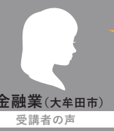
金融業（大牟田市） 受講者の声

期間：2023年10月6日（金）～2024年2月15日（木） 全5日間 + 選択共通講座 対象：係長（監督職）相当職の方 もしくは昇進予定の方 定員：30名（先着順）